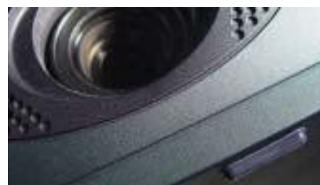
Нескользкие ножки индивидуальной формы Рис.105 3М™ Vimpro™ MB1104-105 идеальны в качестве нескользких ножек для видео проекторов.