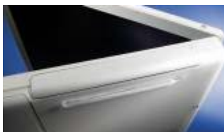
Мягкие амортизаторы индивидуальной формы Рис.104 3М™ Vimpro™ MB1104-102 предназначены для светлых или белых ноутбуков для защиты поверхности от царапин и защиты от скольжения.