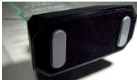
Амортизаторы индивидуальной формы Рис.103 Серия 3М™ Vimpro™ MB1102-113 предназначена для защиты от царапин предметов и поверхностей нестандартной формы.

Примечание: Представленная техническая информация может использоваться корректно только для типовых применений.