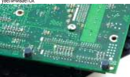
Амортизаторы для печатных плат

Для устранения шума и вибрации используйте амортизаторы серии 5400 белого цвета. Они превосходно подходят для шкафчиков и дверей, обладают шумопоглощающими свойствами, устойчивы к старению и растрескиванию.